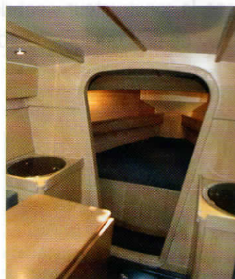
Pas de hauteur debout mais quatre vrais couchages.

Un vrai bateau de croisière de surcroît qui autorise le cabotage à quatre personnes dans le confort attendu grâce à un cockpit profond et agréable – les bancs rapprochés permettent de se caler à la gîte, toutes les manœuvres sont centralisées dans le cockpit – et un intérieur super-cosy en chêne clair : une cabine double avant et deux cabines simples sous le cockpit, et surtout un carré accueillant équipé d'une table amovible – basse