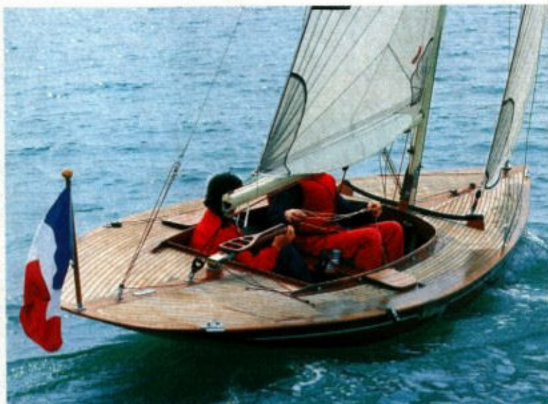
La ligne est marquée par ce magnifique arrière à voûte. Le pont est recouvert de lattes de teck d'un seul tenant, de 7 mètres de long.