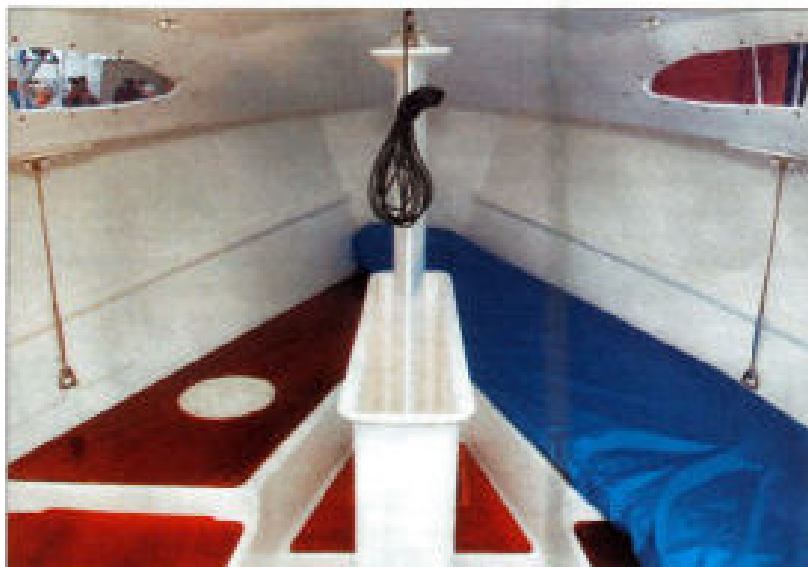
A part le puits de la dérive sabre lestée, l'intérieur de la version de base (Régate) est un peu vide. Mais la version Croisière est très complète.