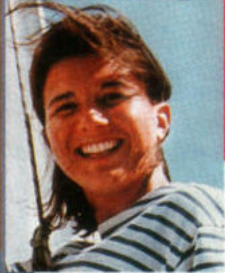
Olivia Maincent